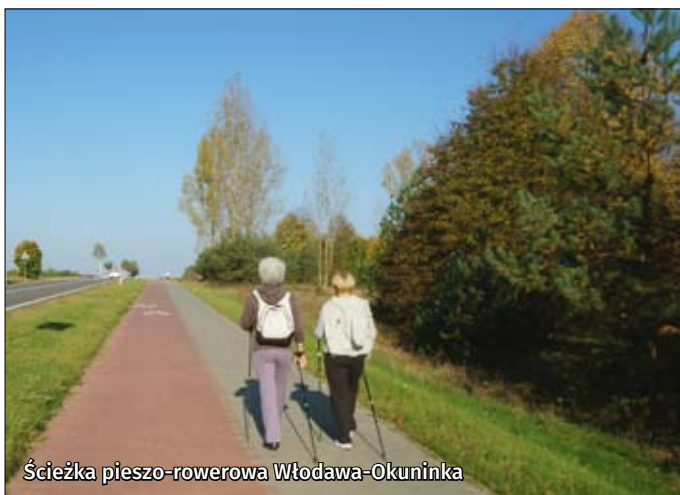
Ścieżka pieszo-rowerowa Włodawa-Okuninka

Pieszy Nadbużański Szlak (czerwony, dł. 74,1 km) rozciąga się wzdłuż rzeki Bug. Jest on bardzo malowniczy i atrakcyjny pod względem przyrodniczym. Trasę urozmaicają dodatkowo obiekty dziedzictwa kulturalno-historycznego. W Hannie, przez którą wiedzie szlak, znajduje się zabytkowy kościół z XVIII w. Dalej na południe, w Różance można zobaczyć pozostałości zespołu pałacowo-parkowo-folwarcznego oraz kościół wybudowany w stylu neogotyckim. Wędrując dalej na wschód w kierunku granicy, można zejść nad samą rzekę, która tworzy na tym odcin-