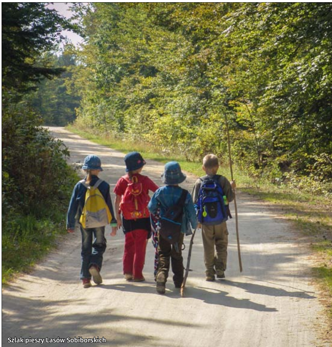
Szlak pieszy Lasów Sobiborskich

ku wyjątkowo malownicze meandry. Będąc we Włodawie – mieście trzech kultur, nie sposób pominąć zespołu kościelno-klasztornego Paulinów z barokowym kościołem, cerkwi prawosławnej oraz synagogi żydowskiej. Przemierzając odcinek Włodawy w kierunku południowym warto zatrzymać się na trójstyku Polski, Białorusi i Ukrainy. W celu noclegu można skorzystać z usług gospodarstw agroturystycznych, np. w Hannie, Szumince, Sobiborze czy w Woli Uhruskiej. Wybierając Siedlisko Sobibór można dodatkowo skorzystać z relaksującej kąpeli w tradycyjnej ruskiej bani na świeżym powietrzu.